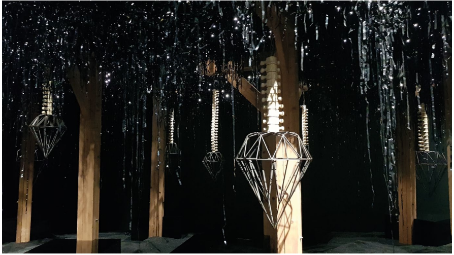
Figure 2. Detail of the Diamondscape (2012) by Pascale Marthine Tayou.

Viimeisen osiossa ”Ihmisen jälki – Tutkimus ja hyödyntäminen” olevat teokset liittyvät esimerkiksi geologisten luonnonvarojen hyödyntämiseen ja maan alle rakennettuihin tiloihin. Yksi tämän osion teoksista on Pascale Marthine Tayoun Afrikan maiden timanttintuotantoa käsittelevä Diamondscape. Teos koostuu muun muassa metallisista timanteista, jotka roikkuvat selkärankaa muistuttavien, pyörivien tankojen päissä (kuva 2). Tästä osiosta löytyy myös Inma Herreran teos ”Through Fire” (2022), joka on tehty yhteistyössä Boliden Kevitsan ja Boliden Harjavalan kanssa.