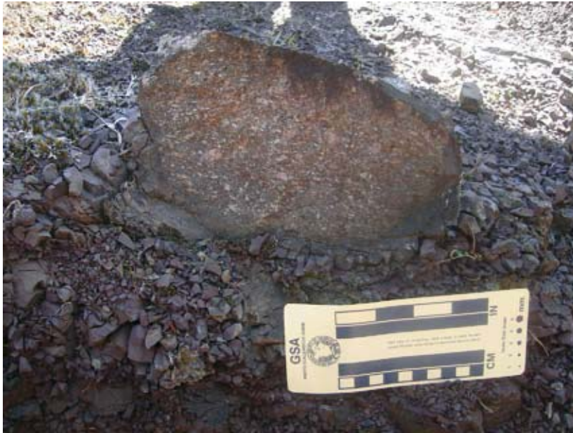
Kuva 3. Pyörästynyt, porfyriittinen lohkkare myöhäisproterotsooisen Bom Jardim-ryhmän Picada das Graças -muodostuman savikivessä. Kuva kirjoittajan.