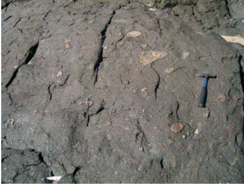
Kuva 2. Myöhäisproterotsooinen diamiktiitti Bom Jardim -ryhmän Picada das Graças -muodostumassa, Camaquã-Superryhmä. Passo da Areia, Lavras do Sul, Etelä-Brasilia. Fig. 2 A Neoproterozoic diamictite within the Picada das Graças Formation of the Bom Jardim Group, Camaquã Supergroup. Passo da Areia locality, Lavras do Sul, southern Brazil.

muodostaen nk. sohjopallomaan ( slushball Earth ). Tällaisten ei-glasiaalisten alueiden paikantaminen on tärkeää, koska näissä tapahtui elämän kehitystä (Hyde et al. 2000, Runnegar 2000). Keskustelu on merkittävää mm. Ediakara-eliöstön ilmestymisen suhteen (ks. Haapaniemi 2006 ja sen viitteet).